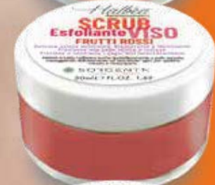
FRUTTI ROSSI FRUITS ROUGES ROTE FRUCHTE FRUTOS ROJOS HF-SVEFR50