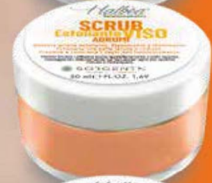
AGRUMI AGRUMES ZITRUS CÍTRICAS HF-SVEA50