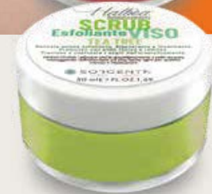
TEA TREE TEEBAUM TEA TREE HF-SVETT50