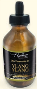
€ 26,49 Ylang Ylang Ylang Ylang Ylang Ylang Ylang Ylang HFP-OEP10ML-YLGYL