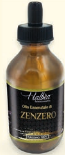
€ 21,49 Zenzero Gingembre Ingwer Jengibre HFP-OEP10ML-ZENZ