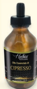
€ 13,49 Cipresso Cyprès Zypresse Ciprés HFP-OEP10ML-CIP

N.B. le immagini dei prodotti sono puramente indicative e possono variare a secondo della disponibilità del packaging. N.B. les images des produits sont purement indicatives et peuvent varier selon la disponibilité d'emballage.